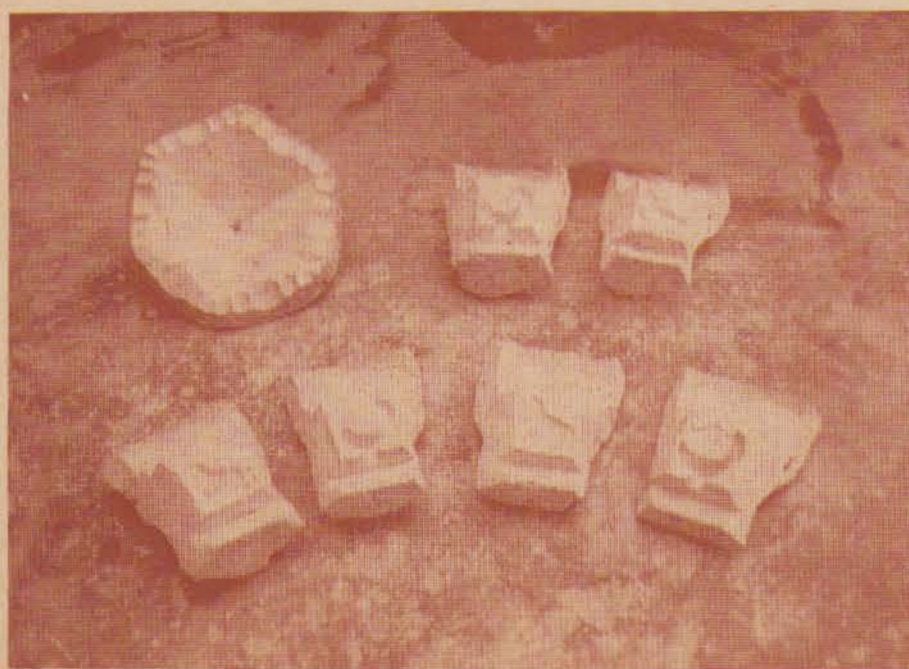
De gipsvorm dient voor het gieten van een tweede, ditmaal hol wasmodel. Ook dit wasmodel wordt ingekapseld, nu in een mantel van vuurvaste klei. In een stookoven geplaatst, brandt de waslaag weg en blijft de definitieve gietvorm over waarin het brons wordt gegoten.