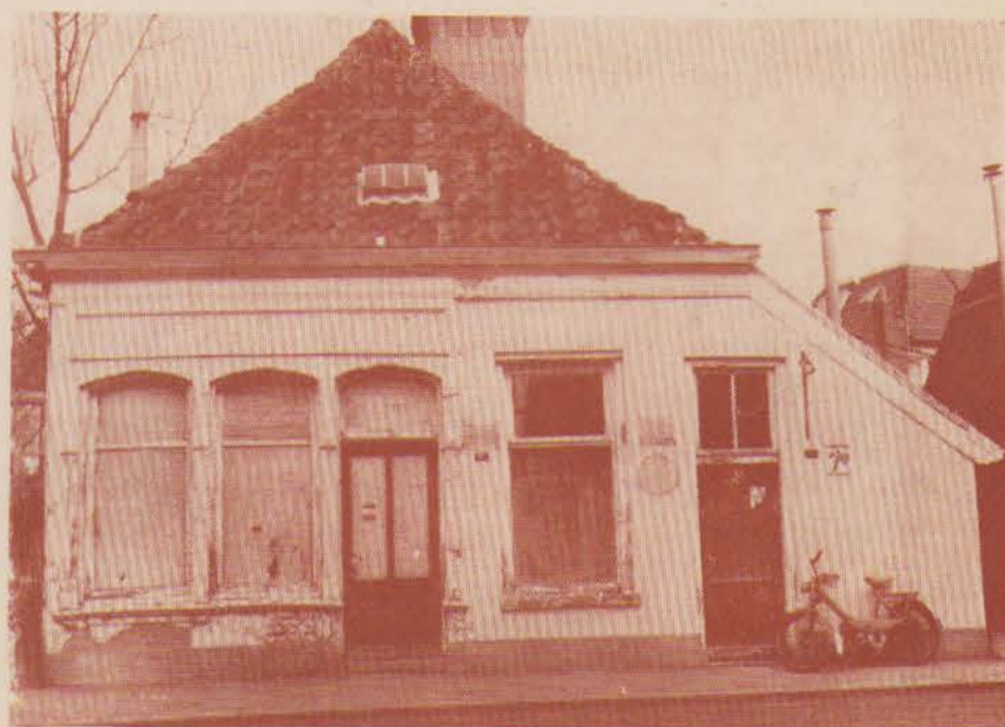
Café „'t Neutje" aan de Pastoriestraat te Hengelo; [foto: febr. 1973]