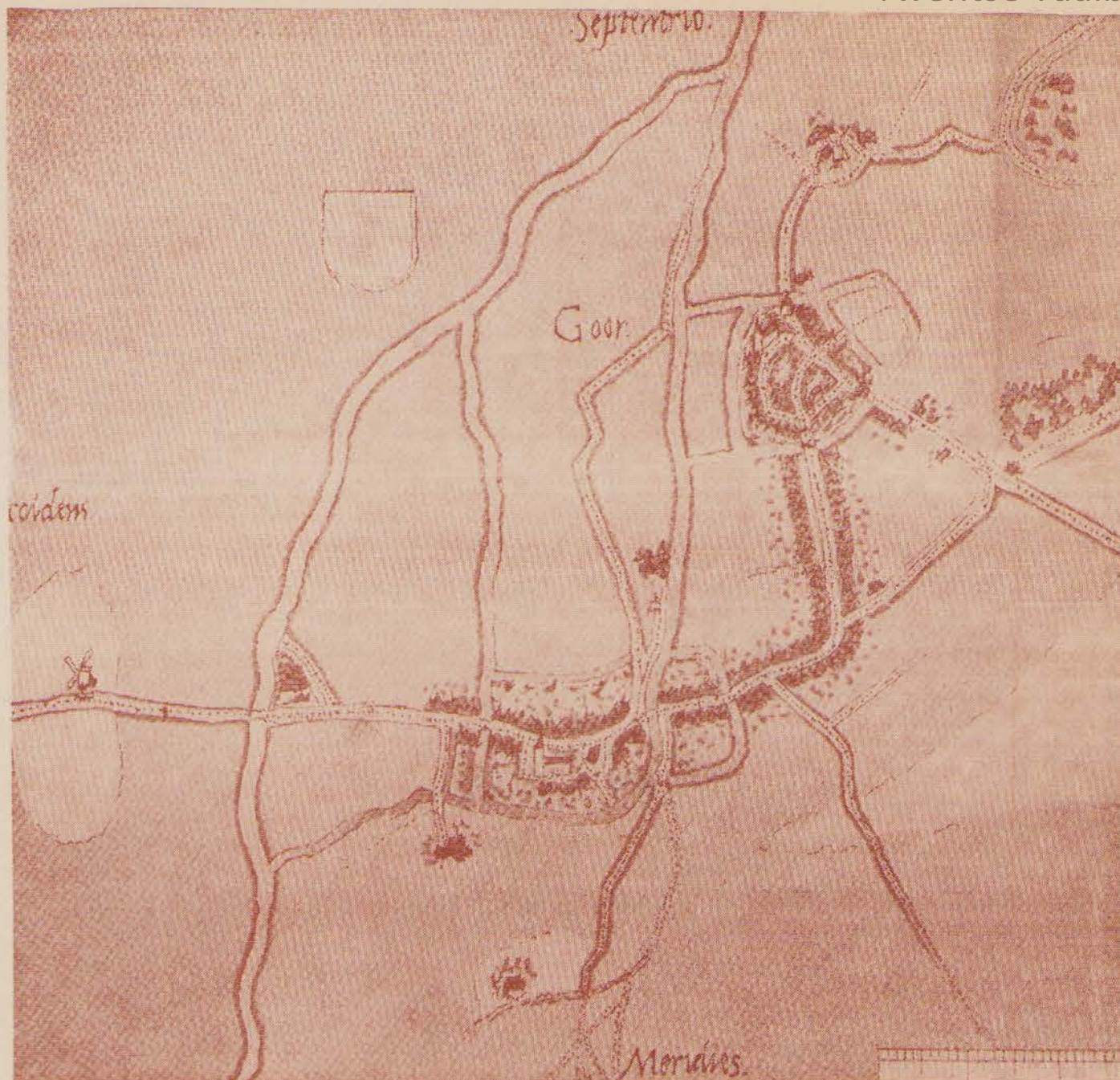
Plattegrond van Goor uit omstreeks 1560, getekend door Jacobus van Deventer; (rechts van de plaatsnaam Goor het 'castrum de Gore', later genaamd 'Het Schild'), Dijken en zandwegen zijn gestippeld aangegeven. Links de Regge.

[VIII] L. A. Stroink, Stad en Land , blz. 76. Wegens gebrek aan bijvondsten kon de palissade niet worden gedateerd.