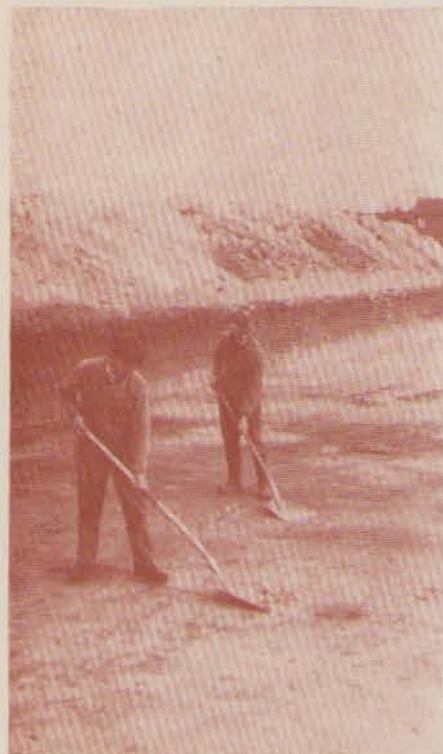
centimeter voor centimeter wordt de bodem afgeschaafd op zoek naar sporen uit het verleden.