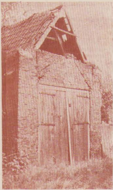
[Foto:] oude bouwval (vermoedelijk eens 'n protestants vlucht-kerkje) op het erve Schipholt nabij de landsgrens te Glanerbrug. Een gevelsteen in de voorgevel draagt het jaartal 1771. Voor een zijaanzicht zie foto onder, waarop voorts de boerderij Schipholt.

in gebruik namen, hetwelk ook thans nog dienst doet als godshuis. Voordien moest men zich behelpen met een houten hulpkerkje dat in 1893 werd gesticht als Evangelisatie-lokaal, de wieg van de latere zelfstandige hervormde gemeente; (1906). Thans telt men een kleine 3000 geboorte-, doop- en belijdende leden.