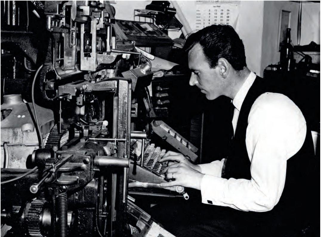
Achter de zetmachine, mei 1968

invloed te kunnen uitoefenen op De Caot. Als hij zijn schoonvader zou kunnen bewegen de grond af te staan, zou Eskes weer uitzicht krijgen op een zinvolle toekomst. In een onbe-waakt moment raakt echter ook Anne zwanger van Eskes. Anne houdt dit geheim en besluit zich elders in de anonimiteit te vestigen. Hermiene krijgt echter een miskraam. Later wordt zij ook nog op tragische wijze door haar eigen vader overreden, waarna de weg vrij komt voor Eskes om toch nog met zijn echte liefde Anne te trouwen. Met dit 'happy end' eindigt ook het verhaal. Eskes is inmiddels volledig tot inkeer gekomen. Door het aandeel van een dorpspastoor krijgt het boek ook nog een stevige religieuze lading. Op het tweede plan komen ook nog andere problematieken aan de orde: rücksichtslos ondernemerschap, bordeelbezoek, homoseksualiteit, hartstocht, zonde, zuiverheid. Het boek van slechts 104 pagina's is een dermate ingewikkelde kluwen van intermenselijke problemen, dat het moeilijk leesbaar is.