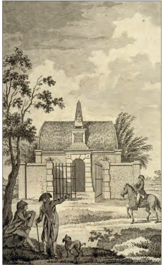
Begraafplaats Van der Capellen