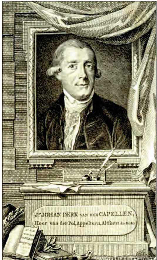
Portret van J.D. van der Capellen tot den Pol.

zijn verlichte ideeën als burgemeester van Arnhem was ontslagen en levenslang uit die stad was verbannen. Joan Derk ging in 1758 in Utrecht rechten studeren en raakte daar overtuigd van de noodzaak tot hervorming van de politiek in de Republiek. Om dat van