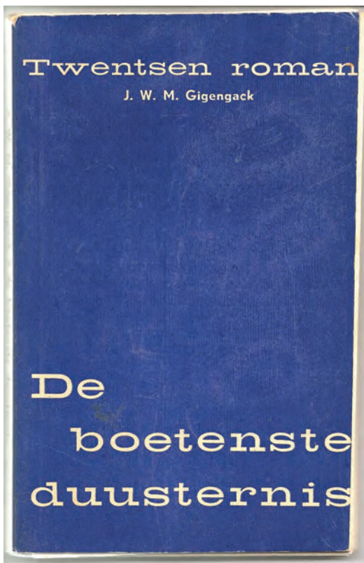
De boetenste duusternis (1961), een omstreden boek

Zijn heemkundige artikelen getuigen van een