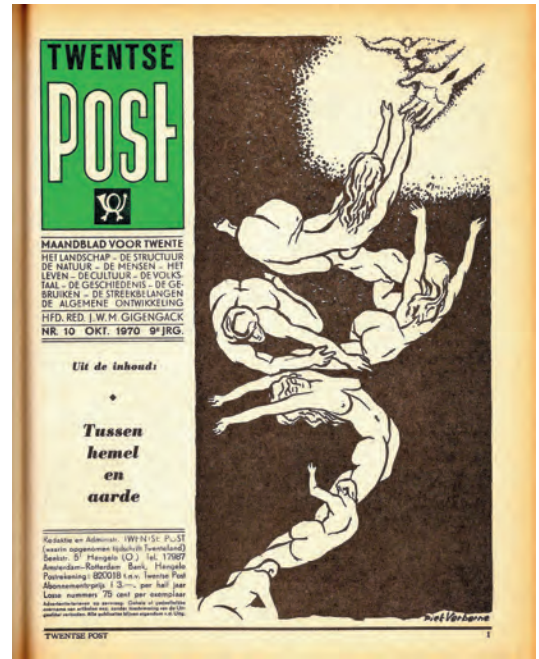
De Twentse Post van oktober 1970

In De Trap der vergezichten onderzoekt Gigengack zijn religieuze ervaringen door ze te spiegelen aan de spirituele symboliek die hij aantreft (of meent aan te treffen) in