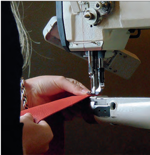
Veilingitem handtas in wording.

Een leuke samenwerking is dus geboren. De goede delen van de gestreepte onderrok kunnen nog heel goed dienst doen als voering voor een tas. Het rode leer komt van "oude" design keukenstoelen. Het wordt een pracht exemplaar. Maar wat te doen met zo'n mooie tas met een bijzonder verhaal? Gewoon verkopen voelt voor beide niet goed. Op zoek naar een goed doel