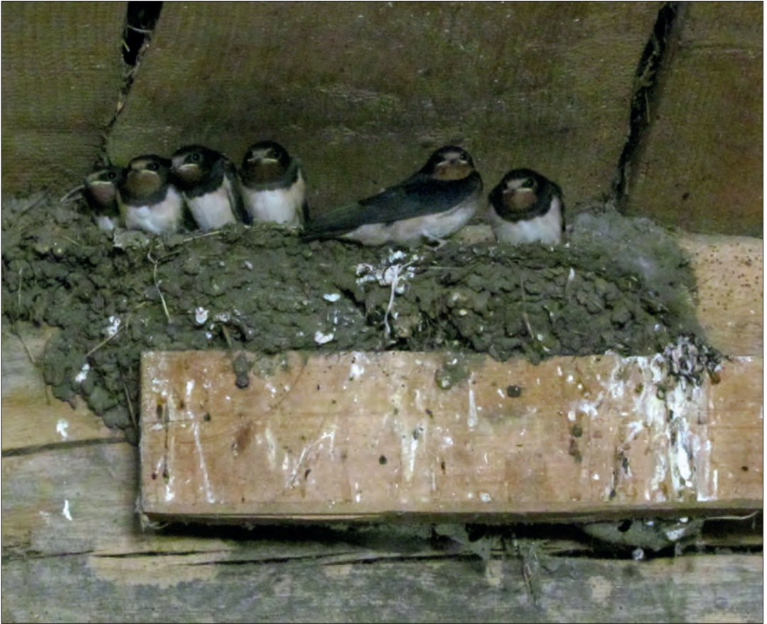
“Hoe lang zouden onze boerenzwaluwen nog terugkeren. Ik maakte me zorgen en begon te tellen.”

zandstenen waterputten. Over gereformeerden en remonstranten, meester Heuvel en zaadhandelaar Kolkman. De kern van Gelselaar is een beschermd dorpsgezicht. Lees en huiver in het boek Dorp zonder zwaluwengewelf , van de hand van Arend Heideman.