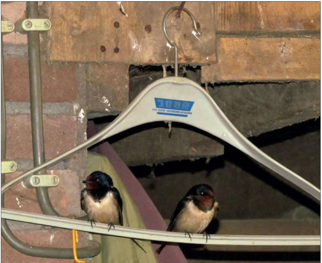
De zwaluwen voelen zich thuis in Gelselaar. Gebruiken zelfs een kleerhanger.

Journalist Heideman woont op het oudershuis, in een boerderij anderhalve kilometer buiten Gelselaar. Een dorp van niks, met zijn zevenhonderd inwoners? Helemaal mis. Dan kijk je niet goed. Het Gelderse dorp op de grens van de Achterhoek en Twente bruist van de verhalen. Over ganzen en