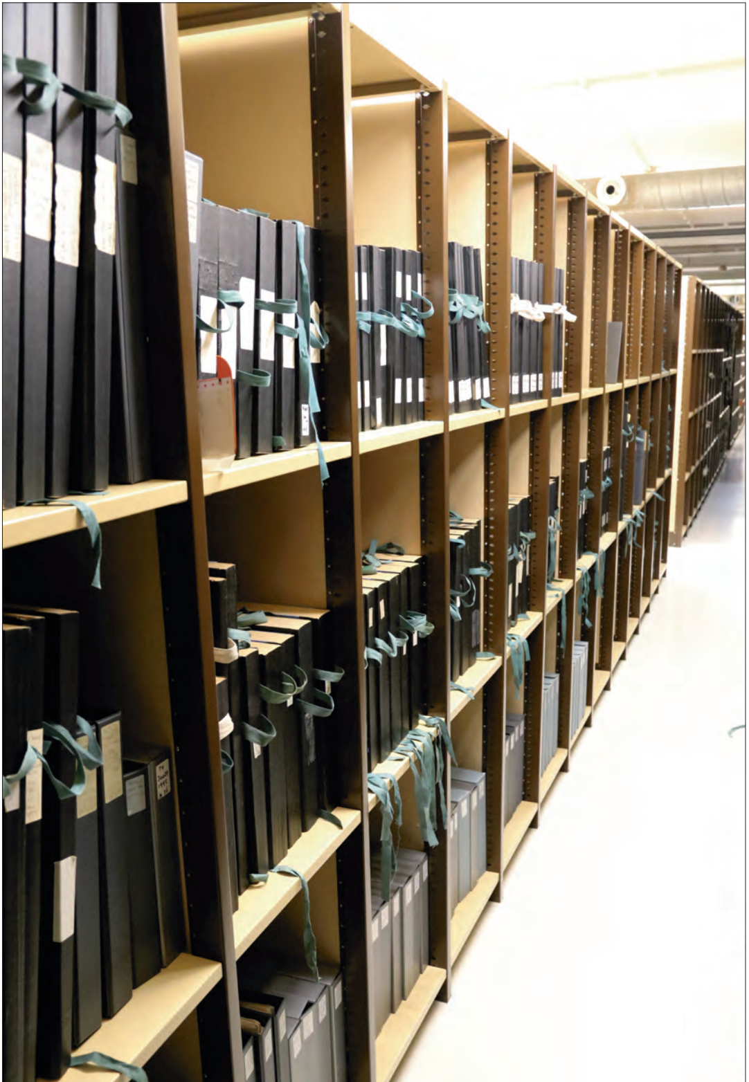
Duizenden meters krantenarchief in de Koninklijke Bibliotheek.