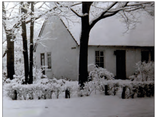
Winter in het Veldwijk.

Het populaire witte dorp in het Veldwijk heeft – geholpen door een flinke opknappbeurt in de jaren tachtig - de tand des tijds meer dan doorstaan. Het woord noodwoning werd al snel geschrapt ten gunste van de kwalificatie semi-permanent. De trotse bewoners zelf spreken over bungalows. Gaandeweg zijn ze geworden tot een monument van wederopbouwstad Hengelo. Net als 't Kotte, het Engelse dorp en de ingenieurswoningen in Vikkershoek. Alle gebouwd vlak na de oorlog met zijn vreselijke bombardementen. Als witte tekens van hoop. Als pioniersplanten kort na de woestijnen.