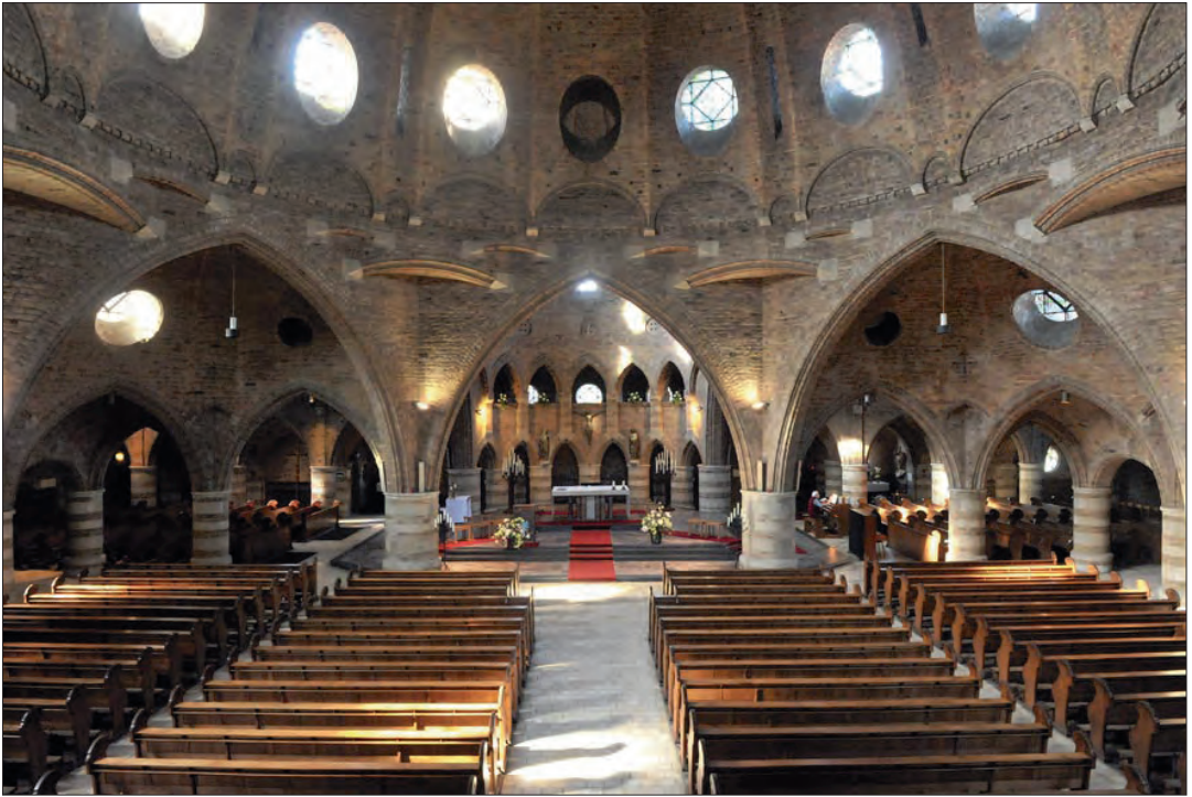
Het interieur van de Sint Jacobuskerk is van een verrassende schoonheid.

schillende torens, en de galerij met zeven rondbogen, met daarachter de houten deuren die toegang geven tot de kerkzaal [8].