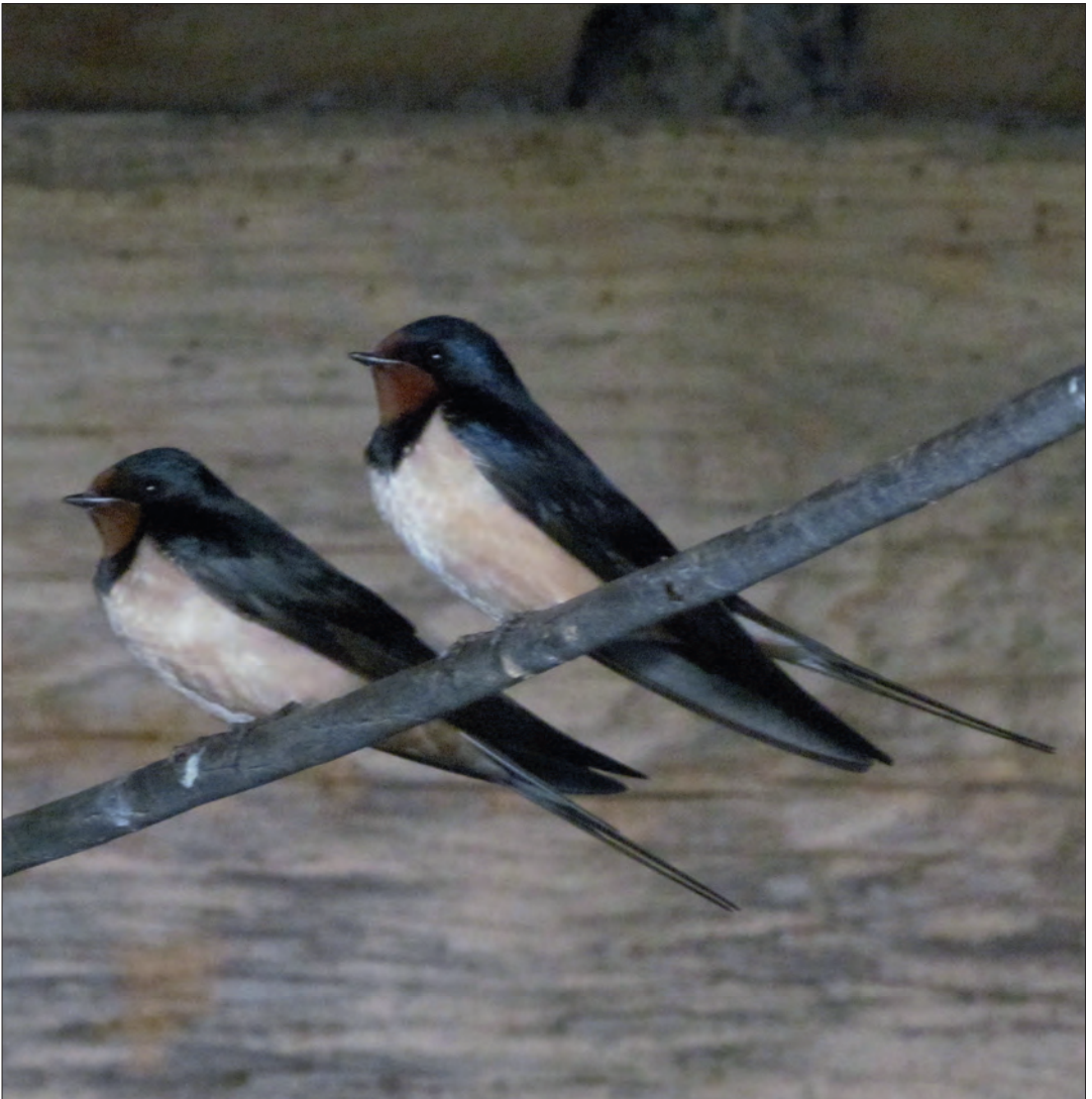
Boerenzwaluwen, herkenbaar aan hun kastanjebruine keel en voorhoofd, overwinteren in Afrika.

“De journalistiek brengt veel stress met zich mee. In je hoofd kun je dat wel verwerken. Ik heb best redelijk gezond geleefd. Het offer kwam in 2009