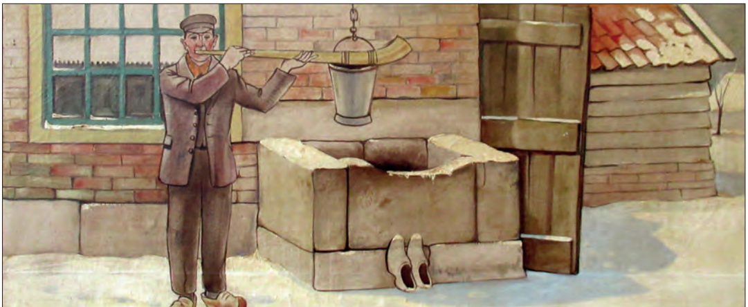
Detail van de wandschildering: het midwinterhoorn blazen.