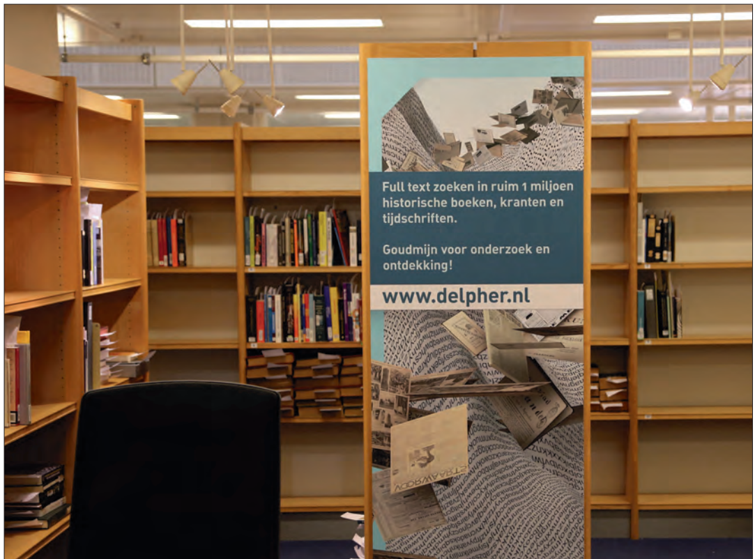
Delpher, een steeds belangrijker bron voor historici.

De toegankelijkheid van Delpher is internationaal gezien bijzonder. De initiatiefnemers slaagden erin om met veel uitgevers afspraken te maken over het auteursrecht. Daardoor kan van huis uit in grote bestanden gesnuffeld worden. Elders in de wereld moet nog steeds de gang naar de erfgoedbewaarders gemaakt worden om het fysieke product in te zien. In Nederland is zo'n hindernis inmiddels uitzondering.