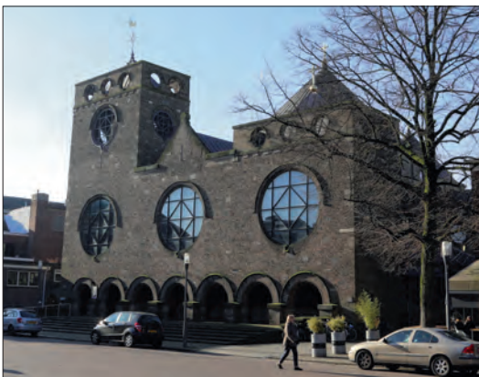
De Sint Jacobuskerk, een rijksmonument.