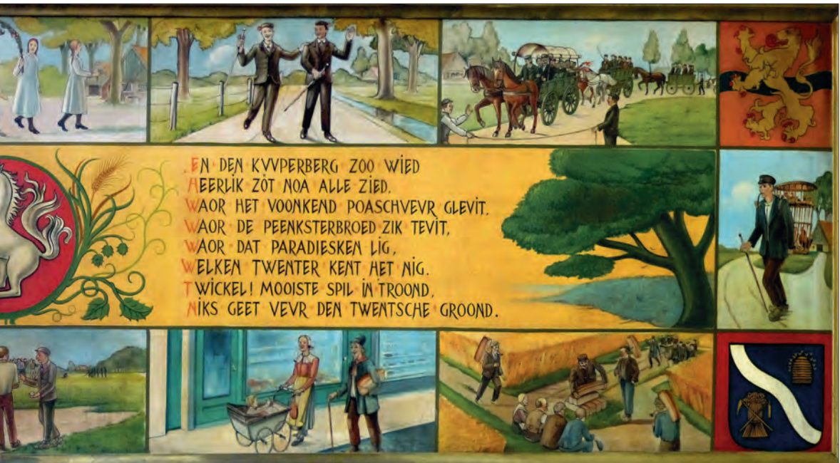
café-restaurant AB naar de Burgerzaal van het stadhuis van Enschede.