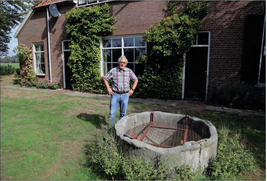
Te vinden in een gebied 75 kilometer rondom Bentheim, waterputten van Bentheimer zandsteen. Het oudst bekende exemplaar met ingekerfd jaartal bevindt zich in Gelselaar en stamt uit 1575.