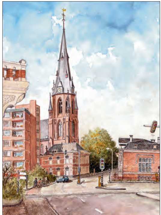
De Sint Jozefkerk in Enschede is sinds enkele jaren het Eucharistisch Centrum van de parochie in Enschede.