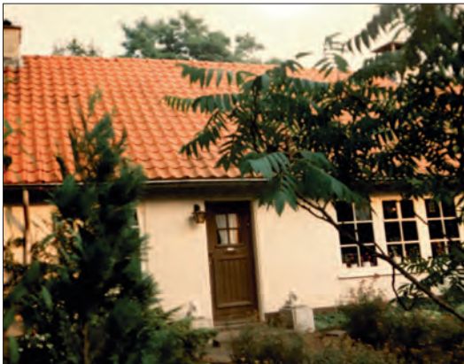
Gagelstraat 4, met destijds nog kleine ruiten.

Nederland – komen 46 woningen. De bouwer? Bredero uit Utrecht. Het bedrijf denkt in prefab betonbouw een snelle oplossing te hebben voor de razende woningnood. De populaire Bredero-woningen verrijzen onder andere in Den Bosch, Coevorden en Enschede. Tot de bouwstroom stagneert. Waarom? Bredero heeft in 1944 noodwoningen gebouwd voor de door bombardementen getroffen burgers van Duisburg. Aanbestedingen gaan plotseling met een boog om Adriaan Bredero heen. Officieel zijn de verwijten nooit hard gemaakt. De lijst met opleverfouten is bij de woningen van het Veldwijk lang. Geen wonder. Goede bouwmaterialen zijn schaars en de gemeente roept op niet al te snel kritiek te hebben. “Wijs ook niet te gauw Sint Bureaucratis als hoofdschuldige aan”, zegt jurist R. de Wijs in het tijdschrift Wederopbouw . “Leg het accent bij de materialenschaarste.”