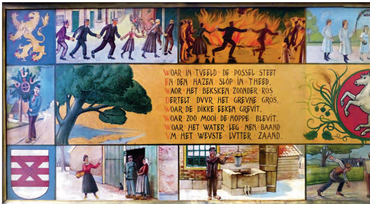
Wandschildering (540 x 139 cm.) met taferelen van Twentse folkloristische gebruiken, begin jaren '90 overgebracht van

Kleinste kerkje Enschede staat aan Schipholtstraat. Nr. 1(1985), p. 15