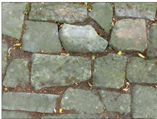
Bentheimer zandsteen op het erf van Zeisenjan op de Lage Hunenburg in Volthe, waarschijnlijk afkomstig van de in 1216 gesloopte woontoren.

De elfde en met name de twaalfde eeuw zorgden voor veel conflicten tussen de twee partijen Welfen en Staufen/Ghibellijnen. Deze Investituursstrijd had niet alleen invloed op de troon van het Duitse rijk, maar ook op de benoemingen van de bisschop van Utrecht, die tevens rijksvorst was. De tegenstellingen brachten met zich mee dat een centraal bestuur regelmatig ontbrak, waardoor veel speelruimte ontstond voor de (kerk)vorsten en de hoge zowel als de lage adel om te proberen hun bezit