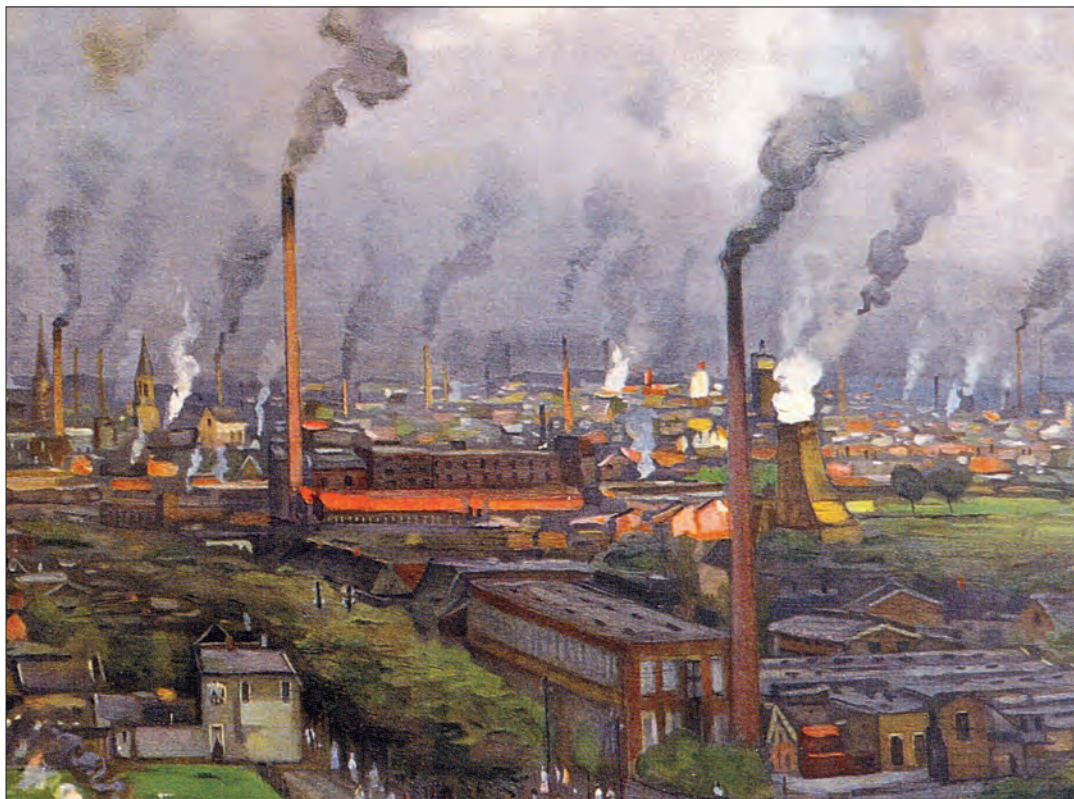
Panorama van Enschede, geschilderd door Herman Heijenbrock in 1916.

melkfabriek gegaan. Heb een steen van de schoorsteen meegenomen. Wat stond daar nou? De Ridder Den Haag. Was dat de schoorsteenbouwer?”