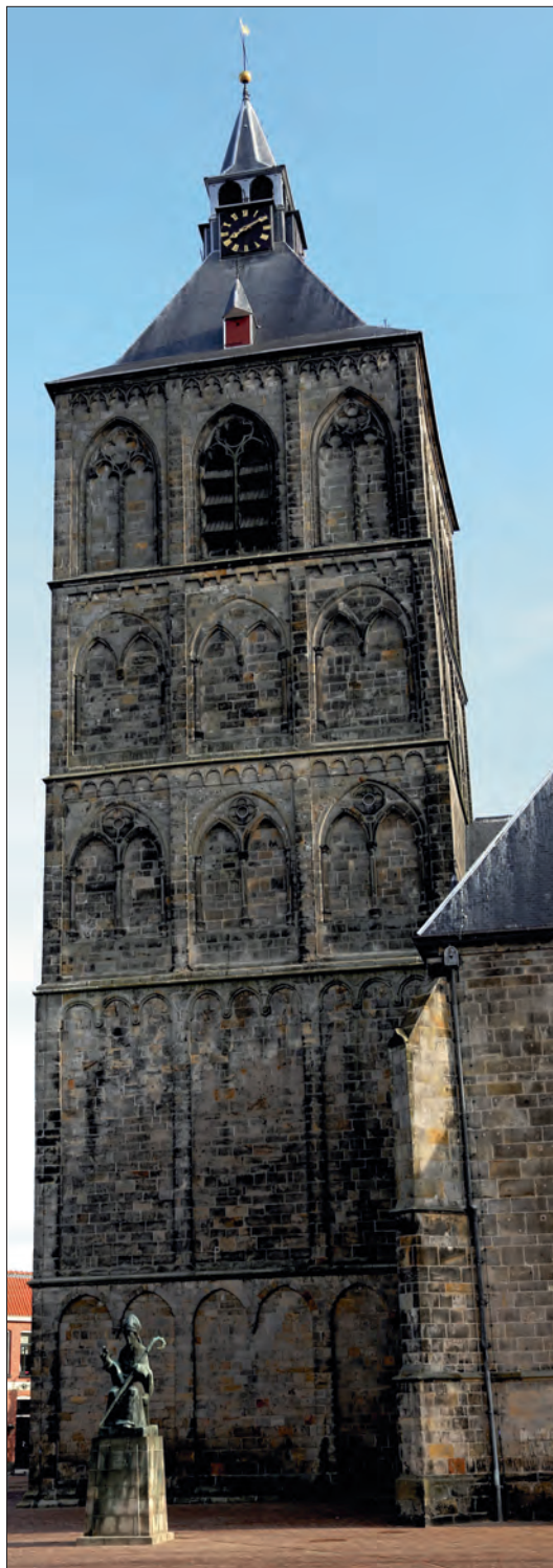
Specialistisch onderzoek kan uitwijzen of het zandsteen voor de toren van de Plechelmus rond 1160 of 1216 uitgehakt is.