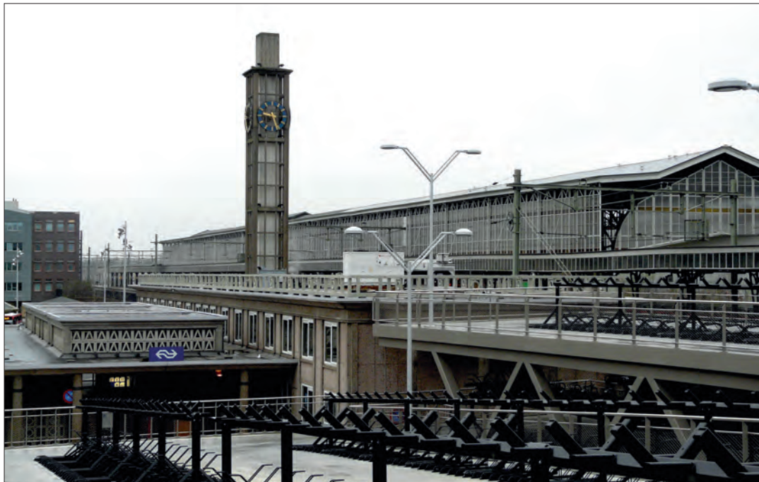
Station Hengelo met schoorsteen uit 1951.