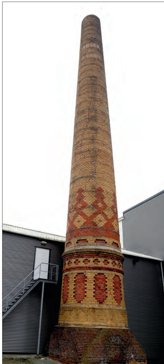
Jansen & Tilanus, Vriezenveen. Gele radiaalsteen met rode versiering. Gebouwd in 1902. Een rijksmonument van 45 meter hoogte, op het bedrijfsterrein van meubelwinkel Löwik.

Westeinde 66 in Vriezenveen. Sta aan de voet van de schoorsteen. Kijk omhoog. Nergens elders in Nederland vind je die gele radiaalsteen met rode versiering. De fabrikant destijds? Jansen & Tilanus. Beter ondergoed was nauwelijks te vinden.