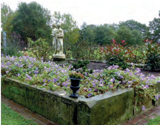
Bloembak bij de familie Kemna in Mander. Het zandsteen is afkomstig van boerderij De Steenhof in Rossum.

Bisschop Hartbert stimuleerde na 1141 de export van Bentheimer zandsteen als bouw materiaal naar omliggende regio's. Voor het verwezenlijken van de imposante Plechelmusbasiliek is niet alleen deze steensoort belangrijk geweest maar ook het ter beschikking hebben van vakmensen en het nodige kapitaal. De relieken van Sint Plechelmus werden vanaf 954 in Oldenzaal bezocht door pelgrims en leverden vanaf die tijd de nodige inkomsten op. Daarnaast beschikte de bisschop over inkomsten uit erven (8) en domeingoederen. Er was dus sprake van kapitaal om de complete nieuwbouw te bekostigen. Maar waren er ook vaklieden en bouwheren voor de Plechelmus en rond 1160 de Hunenborg beschikbaar?