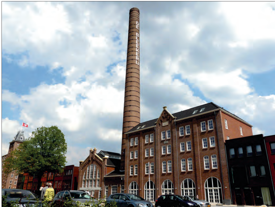
Boekelosche Stoomblekerij uit 1912.

De foto's op pagina 5,6 en 7 komen uit het boek Fabrieksschoorstenen in Nederland .