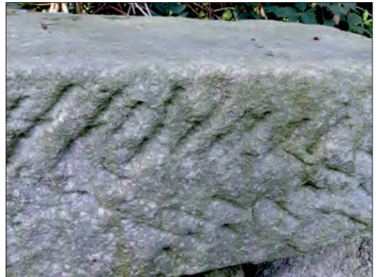
Een bewerkte stuk zandsteen. Herkomst?

Tijdens de eerste bouwfase rond 1160 zijn er op het terrein van de hoofdburcht bijgebouwen opgericht, getuige de bodemsporen die Holwerda in 1916 aantrof. Op de voorburcht was in mijn theorie reeds de hoofdhof met voorraadschuren aanwezig. Het is waarschijnlijk dat daar tevens een aantal behuizingen voor ministerialen en/of ridders bij zijn gekomen naast meer opslag- en stalruimten. De bevoorrading van de bouwplougen in Oldenzaal