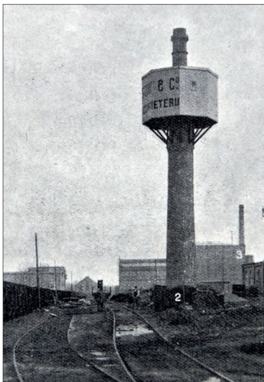
Schoorsteen Dikkers Hengelo met waterreservoir van ijzergieterij Stork, rond 1910.