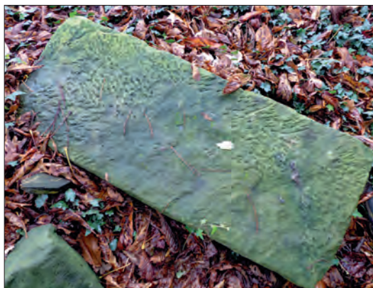
Zandsteen op De Steenhof bij Rossum, mogelijk van de Hunenborg.

Zo kwam naar voren dat er niet alleen sprake is geweest van een fasering met betrekking tot de woontoren, maar ook in de aanleg van het grachtenstelsel. Vreenegoor stelde namelijk vast dat er aan fase 1B zeer waarschijnlijk een oudere fase (1A) vooraf is gegaan. Deze kon echter door gebrek aan vondsten niet precies worden gedateerd. Als de Hunenborg mede bedoeld is geweest om een organisatorische en qua voedselvoorziening logistieke functie in relatie met de bouw van de Plechelmuskerk te vervullen dan lijkt dit de verklaring te zijn voor het relatief grote oppervlak van zowel de hoofd- als de voorburcht. In tegenstelling tot een mottekasteel is er in een tweeledige