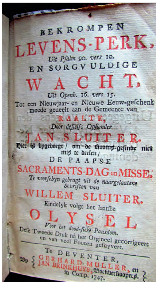
Bekrompen levens-perk, uitgave 1747.