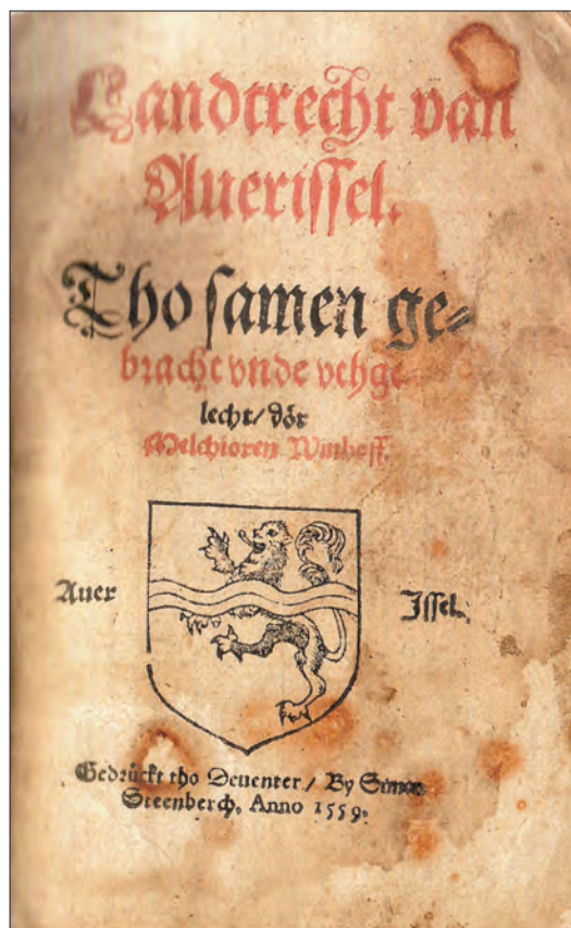
Titelblad eerste uitgave Overijsselse landrechten, Deventer 1559, door Melchior Winhoff uit Ootmarsum. Eerste boekpublicatie van een Twentenaar – bovendien in de streektaal.

Als officier van de militaire inlichtingendienst, tekende hij bij en ging in Eibergen bij de verbindingsdienst werken, in ploegendienst. Dat bood hem genoeg tijd om via de Dienst Welzijnzorg een studie Nederlands te volgen. Hij trouwde in 1973 met Joke en verhuisde naar Groenlo. Toen hij zijn studie Nederlands voltooide had en genoeg had gekregen van het