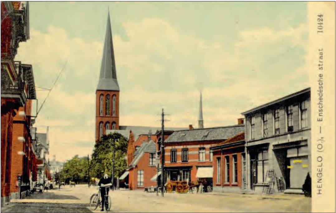
Gezicht op de St. Lambertuskerk en de Enschedesestraat, komende van Enschede ca. 1900.

schenk van niet minder dan f 3600 - en de ander voor een prachtige parketvloer zou zorgen. In weinig maanden tijds was men zoo ver gevorderd, dat de gansche kerk van gebrand glas zou worden voorzien, hing een zware nieuwe klok in den hoogen toren, waren gewelven en muren ge- polychromeerd en tal van meubelen besteld! En aldus is het geschied, dat een gemeente van nog geen 700 huisgezinnen, voor het meerendeel behoorende tot den fabrieks-arbeidersstand, den heer Te Riele, van Deventer, kon opdragen, een schoone imitatie van de munstersche Ueberwas-serkirche over te planten op hollandschen bodem, al gingen met den aankoop van terreinen, met den bouw en de versiering tot op dit oog- nelijk niet minder dan f 170,000 gemoeid! Een heerlijk bewijs voorwaar van hetgeen een- drachtige samenwerking vermag, waar edele geestdrift de harten ontvlamt! Want het is wel dááaraan uitsluitend te danken, dat de toren van Sint-Lambertus zoo fier het twentsche landschap overschouwt. Zag Paus Innocentius eenmaal de waggelende kerk Gods in stand gehouden door de hand van heilige mannen, Franciscus en Dominicus - van Hengelo's kerk kan men getuigen, dat zij staat: door de hand van al haar geloovigen. Zij rust