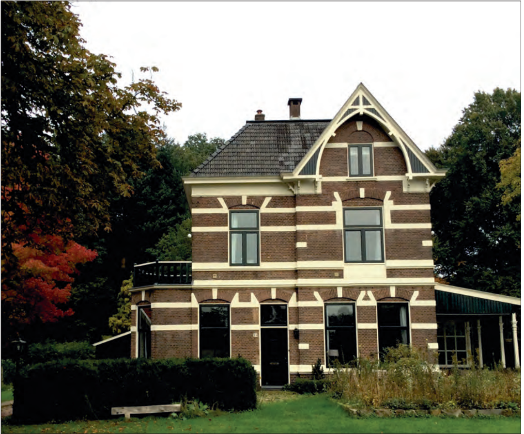
Villa Drienerwolde Drienerwoldeweg 35 Hengelo.