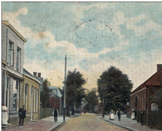
Deurningerstraat rond 1910. Rechts de apostelenhof. Bij de grote boom rechts ligt het boerenkerkhof.

bank stond een overdekte glazen bak vol met rolletjes pepermunt, nogablokken, drop en zo. Telkens als ik er kwam en het duurde lang voordat er iemand kwam om te helpen, kwam ik in