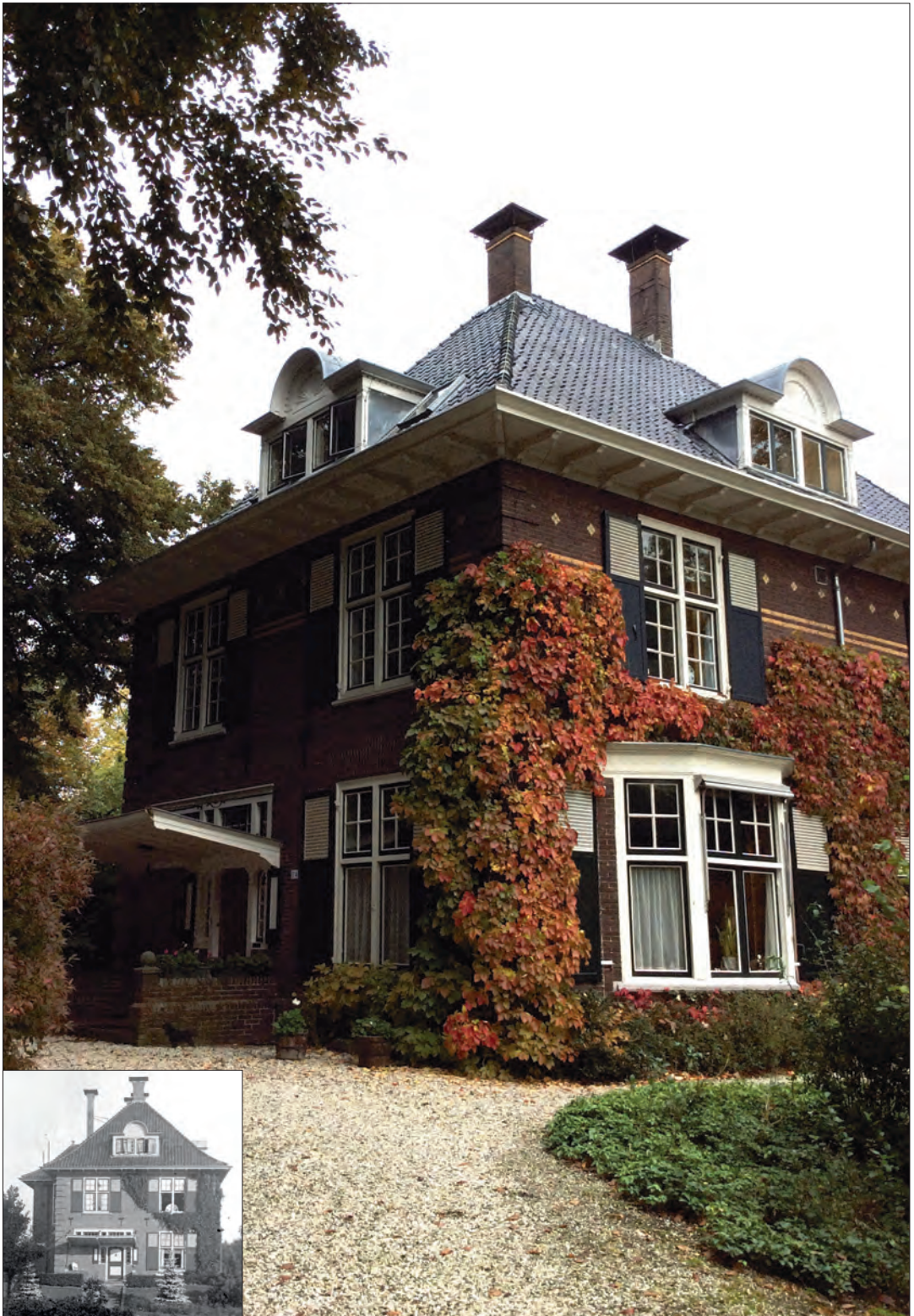
Woonhuis voor- en zijkant Wierdensestraat 114 Rijssen. Ingevoegd woonhuis voormalige situatie.