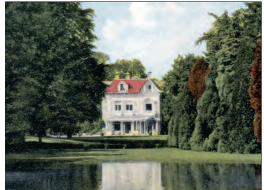
Huize de Kotten.