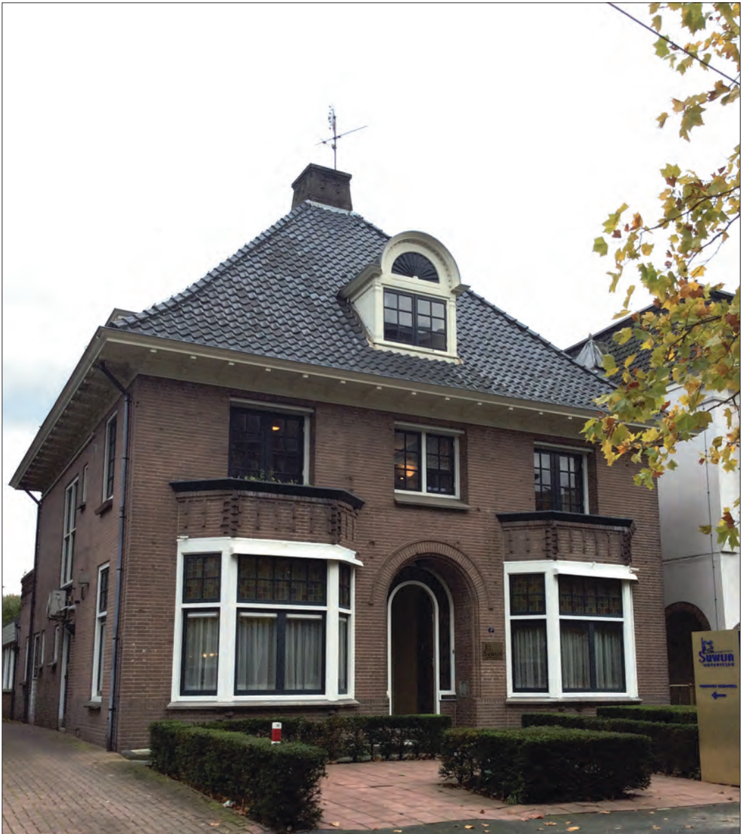
Villa Beursstraat 1B Hengelo.