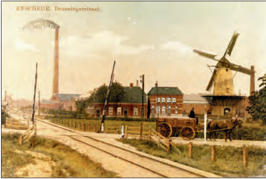
De hoek Deurningerstraat-Kottendijk met de Noordendorpmlen en het spoorlijntje naar Lonneker.

voor de 'oude baas', zoals mijn moeder hem noemde.