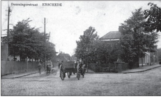
De hoek Deurningerstraat-Kottendijk.

zei met trillende lippen, dat hij het nooit meer mocht van zijn moeder. Toen fluisterde ik mijn buurvrouw toe, dat mijn moeder dat nooit zou zeggen. De meester hoorde het en ik moest herhalen wat ik had gezegd. Gevolg strafregels waarin ik, ik weet niet meer hoeveel keer, op moest schrijven dat ik zoiets niet mocht zeggen. Mijn moeder keek er wel van op. Maar verdere gevolgen had het niet. Overigens ging ik graag naar school. In de tweede klas kon ik een hele tijd niet want ik kwam onder de eczeem te zitten. Een soort vlecht zei men. Elke dag kwam er