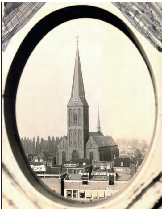
St. Lambertuskerk in de jaren '50, gezien vanuit de Telgenflat aan de Markt.

Nu drie jaar geleden evenwel deed de pastoor opnieuw een beroep op de edelmoedigheid van zijn gemeentenaren, en ofschoon zij dat jaar nog f 1000 meer voor de banken betaalden - in de