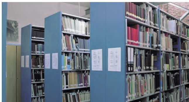
Blik in het depot van het Kennis en Informatie Centrum.

Het KIC is gratis toegankelijk. Wilt u uitsluitend naar het KIC voor het raadplegen van boeken, documenten of beeldmateriaal, meldt dit bij de balie of maak dan een afspraak. Telefoon: 053-480 76 94 (rechtstreeks) Email: deverdieping@twentsewelle.nl Open: woensdag- en vrijdagmiddag van 13.00 tot 16.00 uur. Op deze tijden zijn studiezaalmedewerkers aanwezig om u te helpen. Of anders op afspraak. Catalogus bibliotheek: http://collectie.twentsewelle.nl/