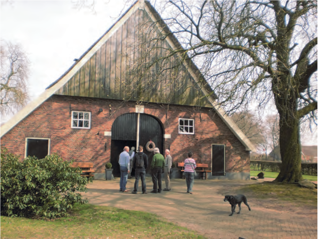
De excursie van 24 maart voerde o.a. naar het erve Woolderink in de marke Rectum.

willen hebben, als je aan een historisch onderzoek begint. Welnu, al je wensen op dit gebied worden in deze cursus vervuld. Niet alleen legt Henk alles piekfijn uit, hij neemt ook alle tijd voor elke vraag. Hij doet het bovendien op een onderhoudende manier. Door de basale onderwerpen en de degelijke explicatie kunnen we spreken van een in alle opzichten `grondlegende` cursus, maar wel op een lichtvoetige manier gebracht.