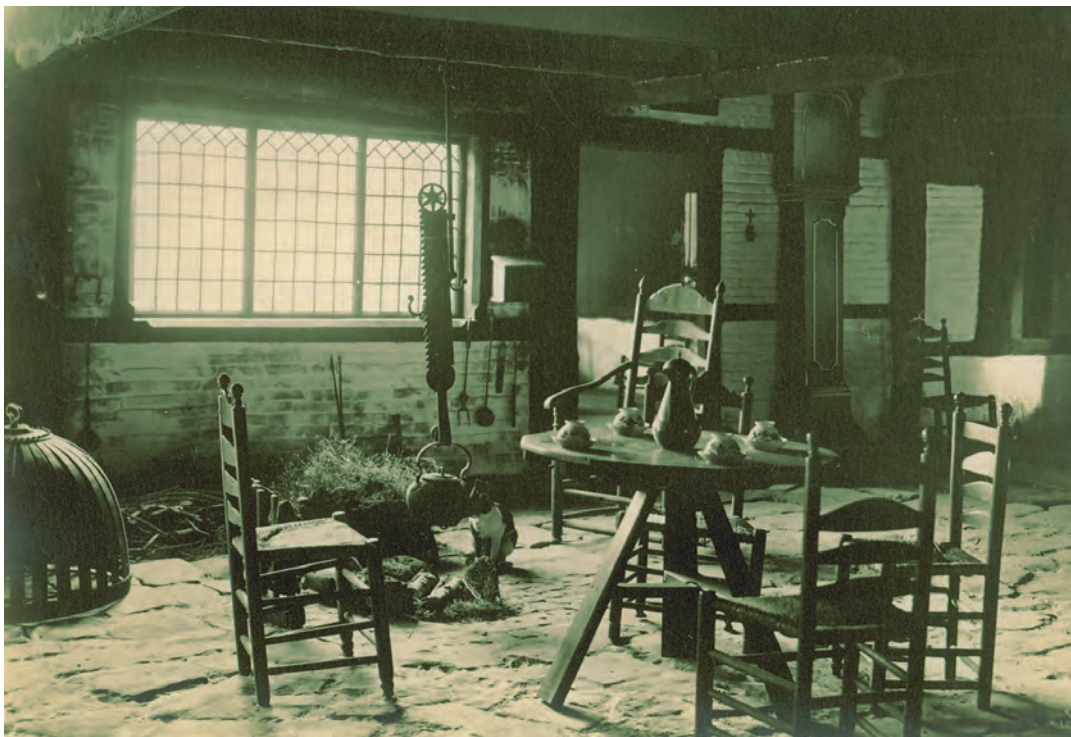
Het interieur van Groot Bavel na de verplaatsing richting Enschede. Ansichtkaart, omstreeks 1950.

deuren. Aangezien de behoefte aan een informatieplek over de ramp onverminderd groot bleef, is het 'los hoes' in de achtertuin van het museum, dat sinds het vertrek van de Oudheidkamer niet meer werd gebruikt [...] als zodanig [sinds september 2002] weer in gebruik genomen." Dit gebeurde tot 2006. Sindsdien is de boerderij grotendeels vergeten. Bezoekers van het Rijksmuseum Twenthe worden op geen enkele wijze op de boerderij geattendeerd. Op de website is Groot Bavel niet te vinden.