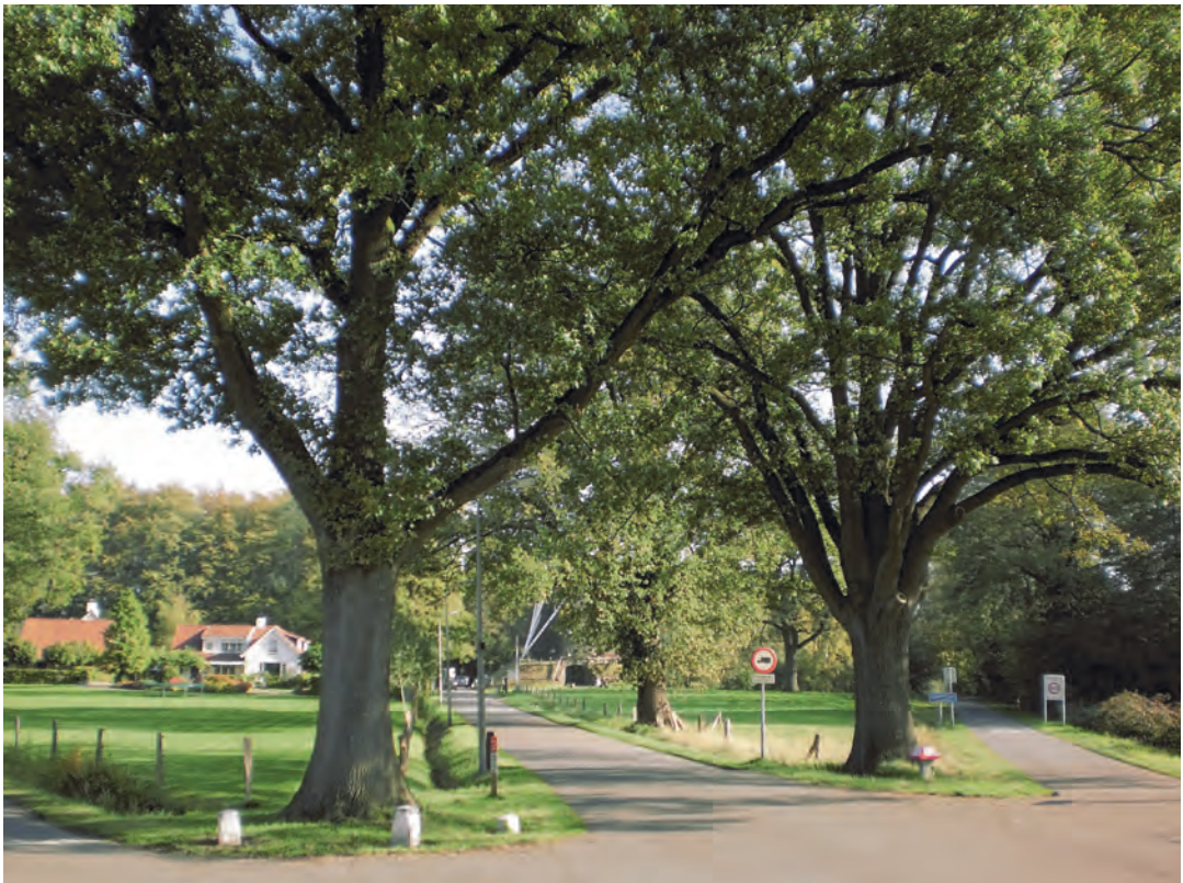
De omgeving van de Lonneker molen, waar Groot Bavel naar toe zou kunnen verhuizen. Foto: Jan Hinke, oktober 2011.

De citaten van Jan Jans en W.H. Dingeldein zijn afkomstig uit de gids die na de verplaatsing van het los hoes is verschenen (eerste druk, 1937; tweede druk, 1947).