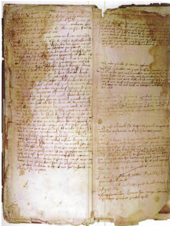
Pagina uit het pachtboek van Herman Goossen Grubbe.

F.H. Grobbe, Het pachtboek van Herman Goossen Grubbe tot Herinckhave, 1638 tot en met 1679 – Een Twentse samenleving in de gouden eeuw, [eigen beheer], Amstelveen, 2011, ISBN (set) 978.90.81740.3.8. € 60,- excl. verzendkosten. Bestellingen: f.h.grobbe@hetnet.nl