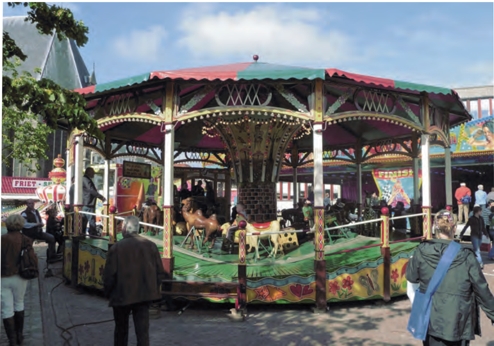
Hobbelende geit of golfbaan in Oldenzaal.