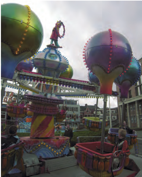
Kermis bij het stadhuis in Hengelo.