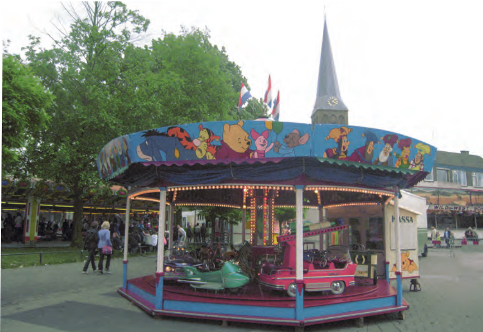
De Draaimolen op het Hengelose marktplein.

Almelo opent de rij van Twentse najaarskermissen. Kermis in Almelo is altijd een volksfeest zonder weerga geweest. Voor de Tweede Wereldoorlog was de dinsdag voor de kinderen, de woensdag voor de oudere jeugd, voor boeren en buitenlui de donderdag en de laatste dag op vrijdag was