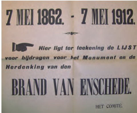
Poster voor de oproep tot intekening.