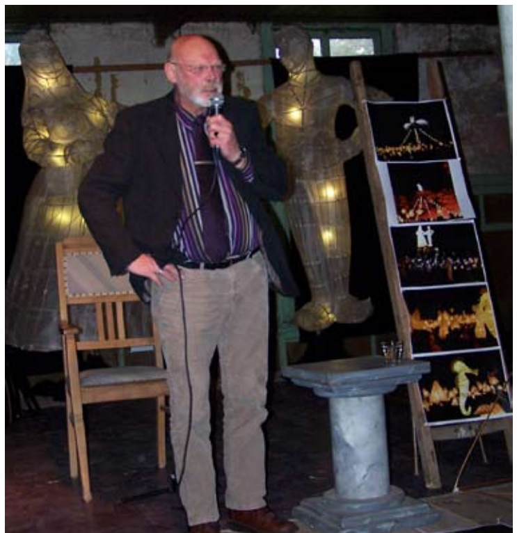
Diepenheim 30 oktober 2010

Wi-j open dat Jan die vaste aand tegene'komen is en weinsen Joke, kienders, kleinkinders en værdere familie veur now en de toekomst vule stærkte toe.